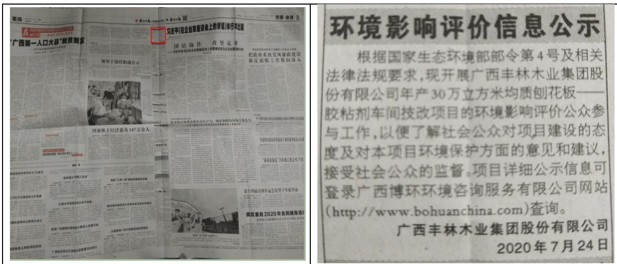
图 2.2-2 第二次报纸公示