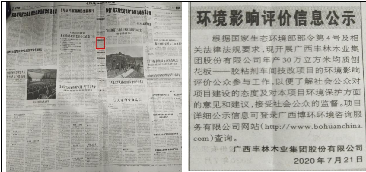
图 2.2-1 第一次报纸公示